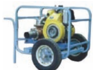
Мотопомпа «Заря» 120/60

– Борис Николаевич, как бы вы охарактеризовали основные отличия насосной техники, предназначенной именно для перекачки высоковязких жидкостей?